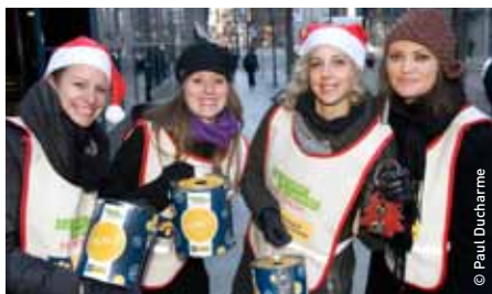
Grande guignolée des médias