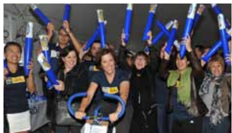
Roulons pour le diabète juvénile

Nos employés et dirigeants ont participé et contribué à plusieurs campagnes de levée de fonds au cours de l'année 2012, dont Roulons pour le diabète juvénile, Movember, la Grande guignolée des médias, la Fondation CURE pour le cancer du sein, 300 km pour la vie (Fondation de la Cité de la santé), la Coupe de soccer Centraide et plusieurs tournois de golf annuels.