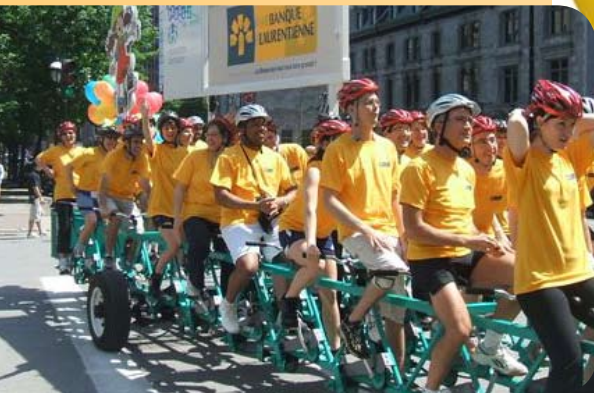
Pédalez pour les enfants