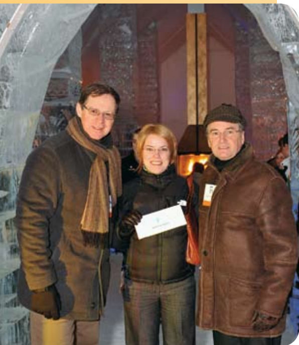
La magie de l'Hôtel de Glace