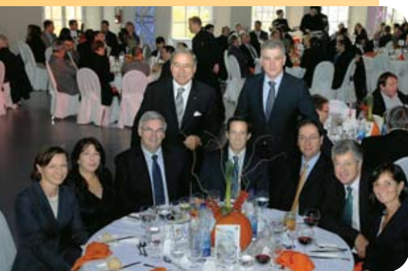
Dîner de la Fondation OLO