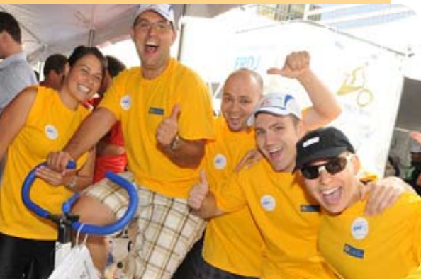
Roulons pour la recherche sur le diabète

Depuis cinq ans, l'implication de nos employés se manifeste de façon percutante lors de La grande guignolée des médias, un événement annuel qui a lieu au début du mois de décembre. Lors de cette journée, plus de 1 000 employés participent à l'organisation d'activités de collectes de fonds dans nos succursales, centres d'affaires et édifices corporatifs, de même que 70 collectes dans la rue à travers le Québec.