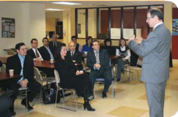
La Tournée de la direction