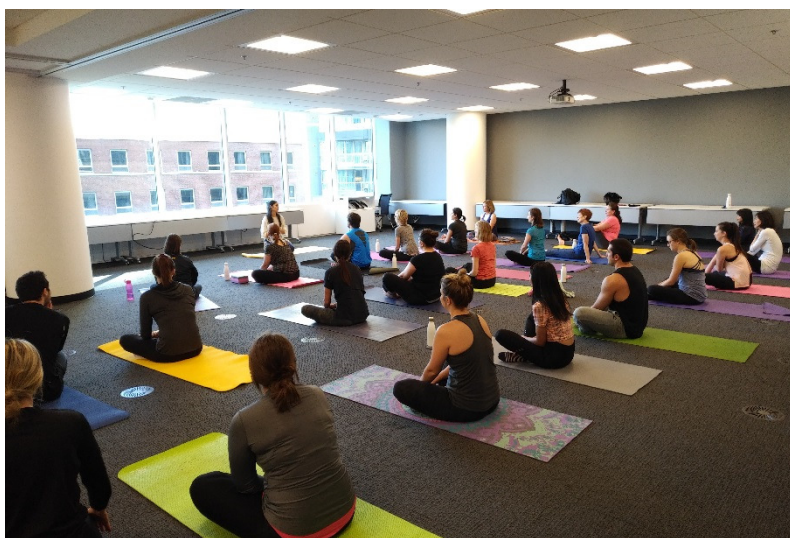
Membres de l'équipe bénéficiant d'une séance de yoga à l'heure du lunch pendant la semaine de sensibilisation à la santé mentale

Le Groupe encourage également l'implication dans diverses activités physiques, comme des équipes de balle molle et de volleyball et un club de course, qui reçoivent une contribution corporative. Nous remboursons aussi aux membres de notre équipe les frais d'adhésion à un club sportif.