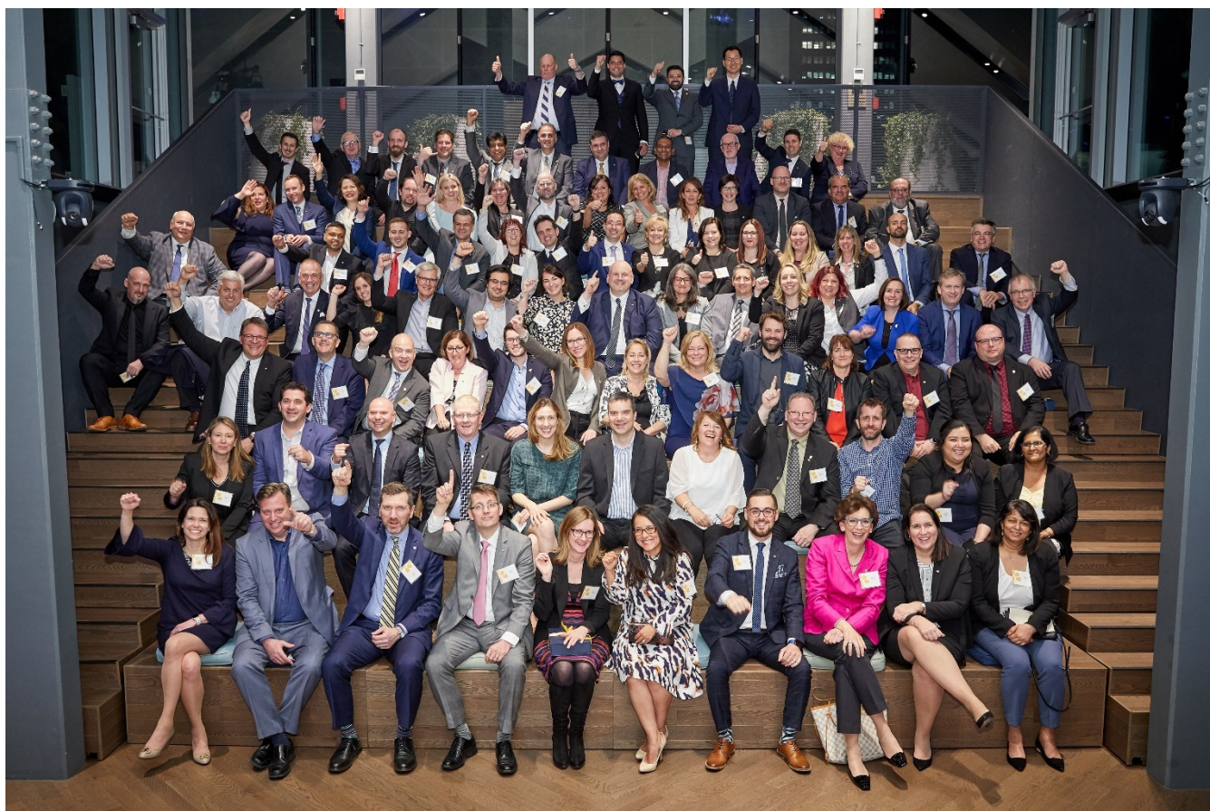
Les récipiendaires des Prix Performance de niveau Groupe ont été célébrés à Montréal en mai 2019.