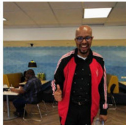
Événements pour appuyer le mois de la Fierté dans nos bureaux corporatifs de Montréal et Toronto